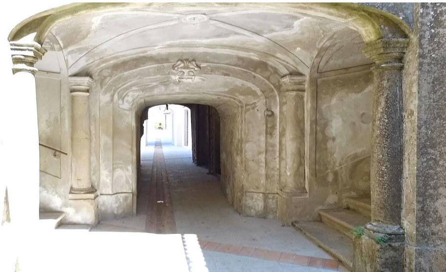
interno storico "la Filanda" San Vito Sullo Jonio